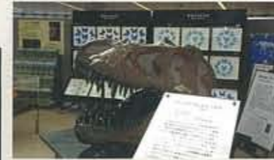
▲3.20～ひとくはく IN エクラ 三田市「人と自然の博物館」がエクラで出張展示。