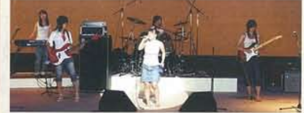
▲8.27 バンドフェスタ INエクラ 市民参加型のイベント。 13グループが参加。