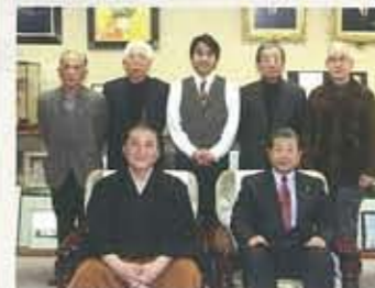
▲3.26 講演と室内楽で綴る 「ふるさと小野」 音楽絵巻 エクラオープン1周年記 念特別企画として開催。