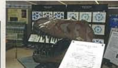
▲3.20～ひとくはく IN エクラ 三田市「人と自然の博物館」がエクラで 出張展示。