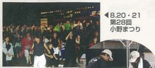
▲8.20・21 第28回 小野まつり