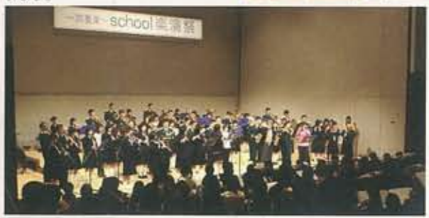
▲2.29 ～吹奏楽～ school 楽演奏祭 最後の合同演奏は感動を 呼びました。