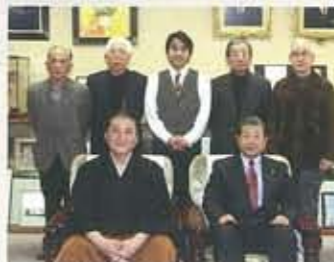
▲3.26 講演と室内楽で綴る 「ふるさと小野」 音楽絵巻 エクラオープン1周年記 念特別企画として開催。