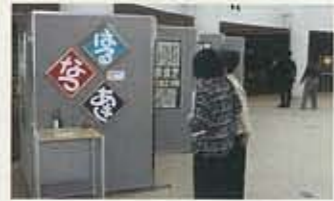
▲9.7 エクラギャラリー 常設ギャラリー開放事業をスタート！！