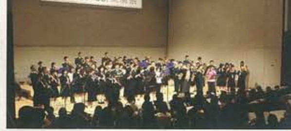
▲2.29 ～吹奏楽～ school 楽演奏祭 最後の合同演奏は感動を 呼びました。