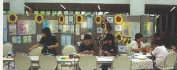
▲7.3 エクラでエコ 「みんなのエクラ企画」 初のサロンを使用したイベント。