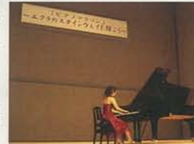
3.26 ピアノマラソン▶ 50人以上の市民ピアニストが スタインウェイを弾き継ぎました。