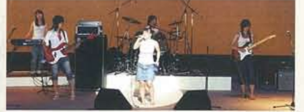
▲8.27 バンドフェスタ INエクラ 市民参加型のイベント。 13グループが参加。