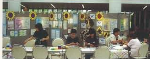
▲7.3 エクラでエコ「みんなのエクラ企画」初のサロンを使用したイベント。