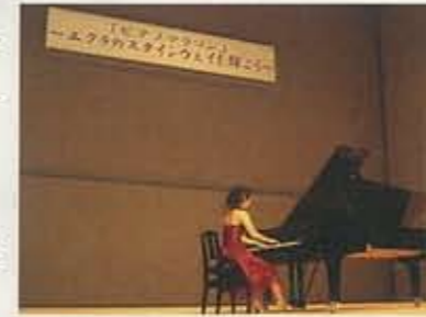
3.26 ピアノマラソン▶ 50人以上の市民ピアニストがスタインウェイを弾き継ぎました。