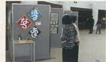
▲9.7 エクラギャラリー 常設ギャラリー開放事業を スタート！！