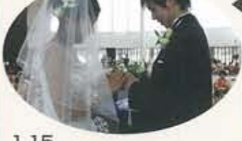
▲12.24 エクラ初の結婚式