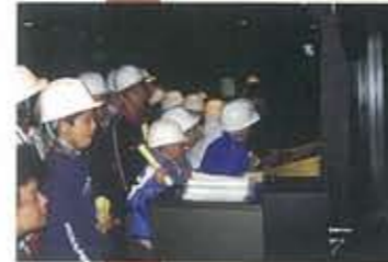
▲3.21 エクラバックステージツアー 生まれたてのエクラホール裏側を探検。