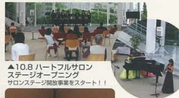
▲10.8 ハートフルサロン ステージオープニング サロンステージ開放事業をスタート！！