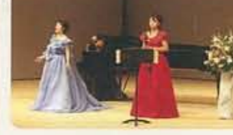
▲11.23 音の宝石箱 公募型のイベントも 定着してきました。