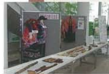
▲7.30 みんなく IN エクラ 民族衣装の展示とミニコンサート。