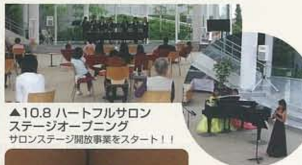
▲10.8 ハートフルサロン ステージオープニング サロンステージ開放事業をスタート！！