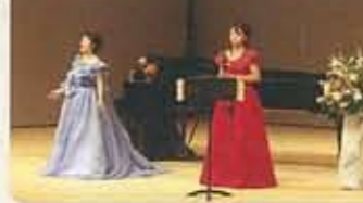
▲11.23 音の宝石箱 公募型のイベントも 定着してきました。