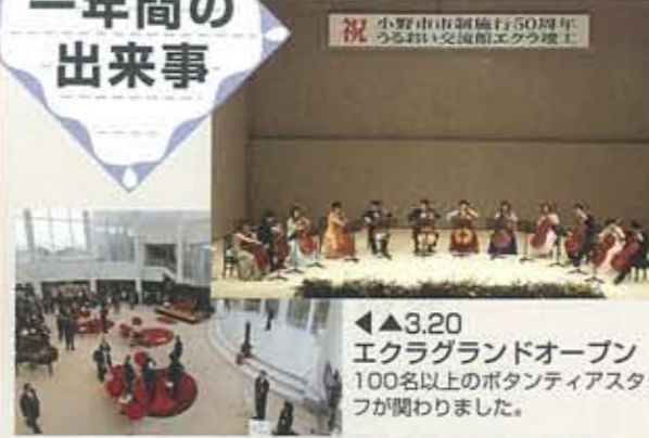
▲3.20 エクラグランドオープン 100名以上のボランティアスタッフ が関わりました。