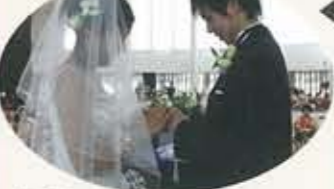
▲12.24 エクラ初の結婚式