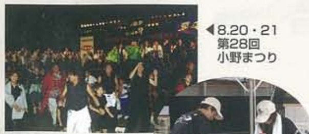
▲8.20・21 第28回 小野まつり