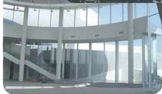
●ハートフルサロン