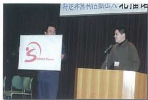
▲「シンボルマーク」の決定!!