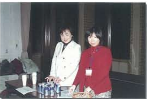
▲ お飲物はいかがですか?