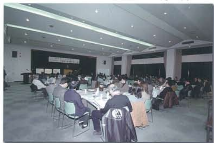
▲ NPO法人 北播磨市民活動支援センター例会風景