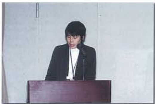
▲ 向山事務局長による経過報告