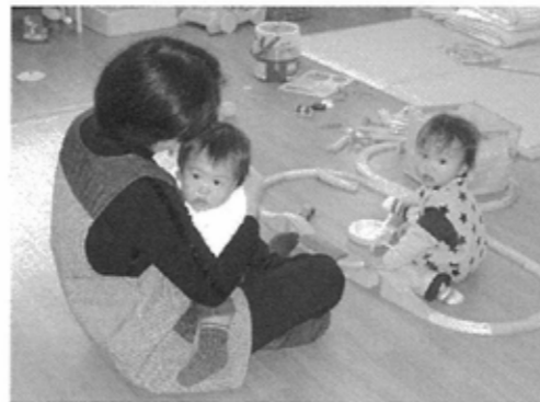
エクラ託児ルーム「ちびっこバク」

開始時期: 10月から月2回程度予定しています *うるおい交流館の託児ルームを開放します! 気軽におしゃべりを楽しみませんか?