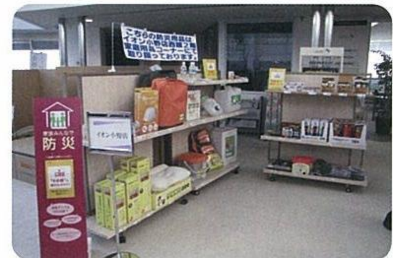
防災グッズや避難所用段ボール製簡易ベッドの展示