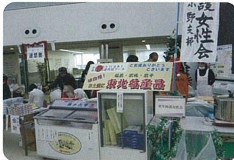
被災地支援、東北物産展